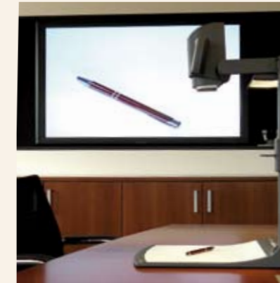
Der Visualizer ermöglicht die Abbildung von 3D-Objekten.