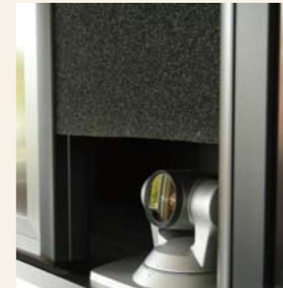
Die integrierte Kamera ist nahezu unsichtbar.

LOTOS schuf für die Hawesko intelligente Büromöbel nach Maß, die den Alltag im Konferenzraum vereinfachen. ASC lieferte eine hochwertige und unkomplizierte Medientechnik, die sich gestalterisch dezent einfügt – dabei gleichzeitig hochmodern ist. Besonderen Wert beim perfekten Zusammenspiel von Möbel und Technik wurde auf die Details gelegt: Die Anschlussfelder im Konferenztisch verschwinden bei Nichtbenutzung und hinterlassen eine geschlossene Tischfläche; die Monitore wurden nahtlos in eine Trockenbauwand integriert. Ein Technik-Rack nimmt alle wesentlichen Komponenten (wie die Videoausstattung auf); es ist unsichtbar und dennoch wartungsfreundlich in einem Möbel untergebracht. Ein ausgeklügeltes Lüftungssystem sorgt für störungsfreien Betrieb ohne akustische Beeinträchtigung.