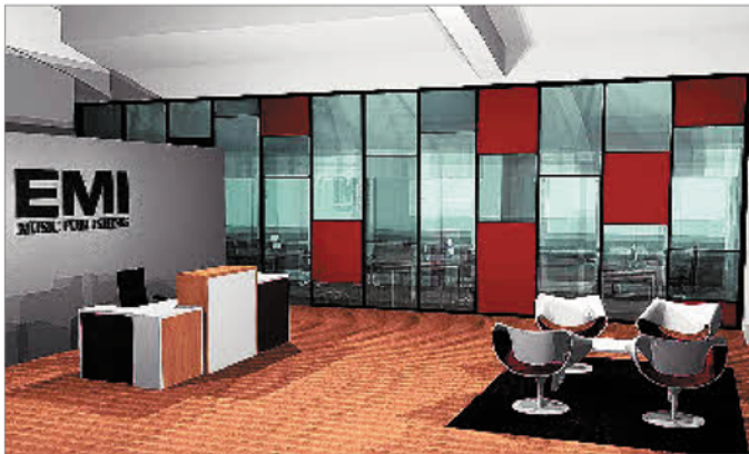
Für den Musikverlag EMI Music Publishing, der neue Räume im Medizinzentrum am Rothenbaum in Hamburg bezogen, entwarf die Manufaktur Lotos die Büroeinrichtung.