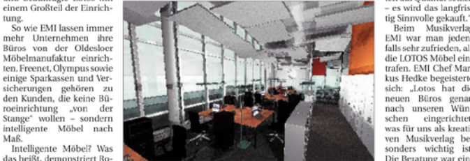
Die Möbelmanufaktur Lotos in Bad Oldesloe entwickelt spezielle Lösungen für Ihre Kunden.